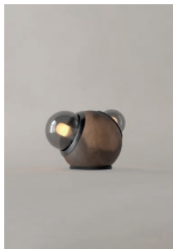
LM14 (Barro Moteado)