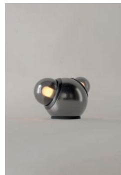
LM15 (Barro Negro)