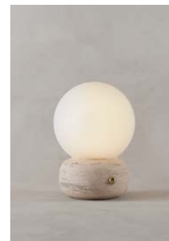
LM24 (Mármol Travertino)