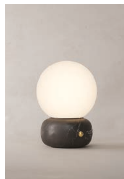
LM11 (Mármol Negro)