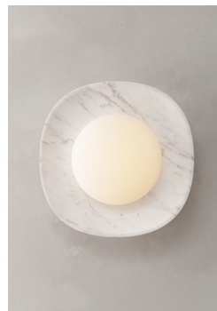
LS04 (Mármol Blanco)