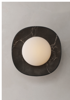
LS03 (Mármol Negro)