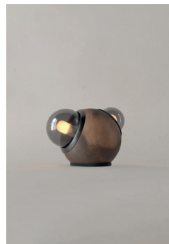
LM14 (Barro Moteado)