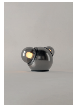
LM15 (Barro Negro)