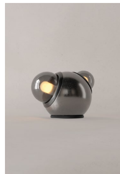
LM15 (Barro Negro)