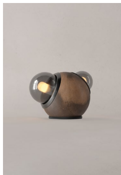
LM14 (Barro Moteado)