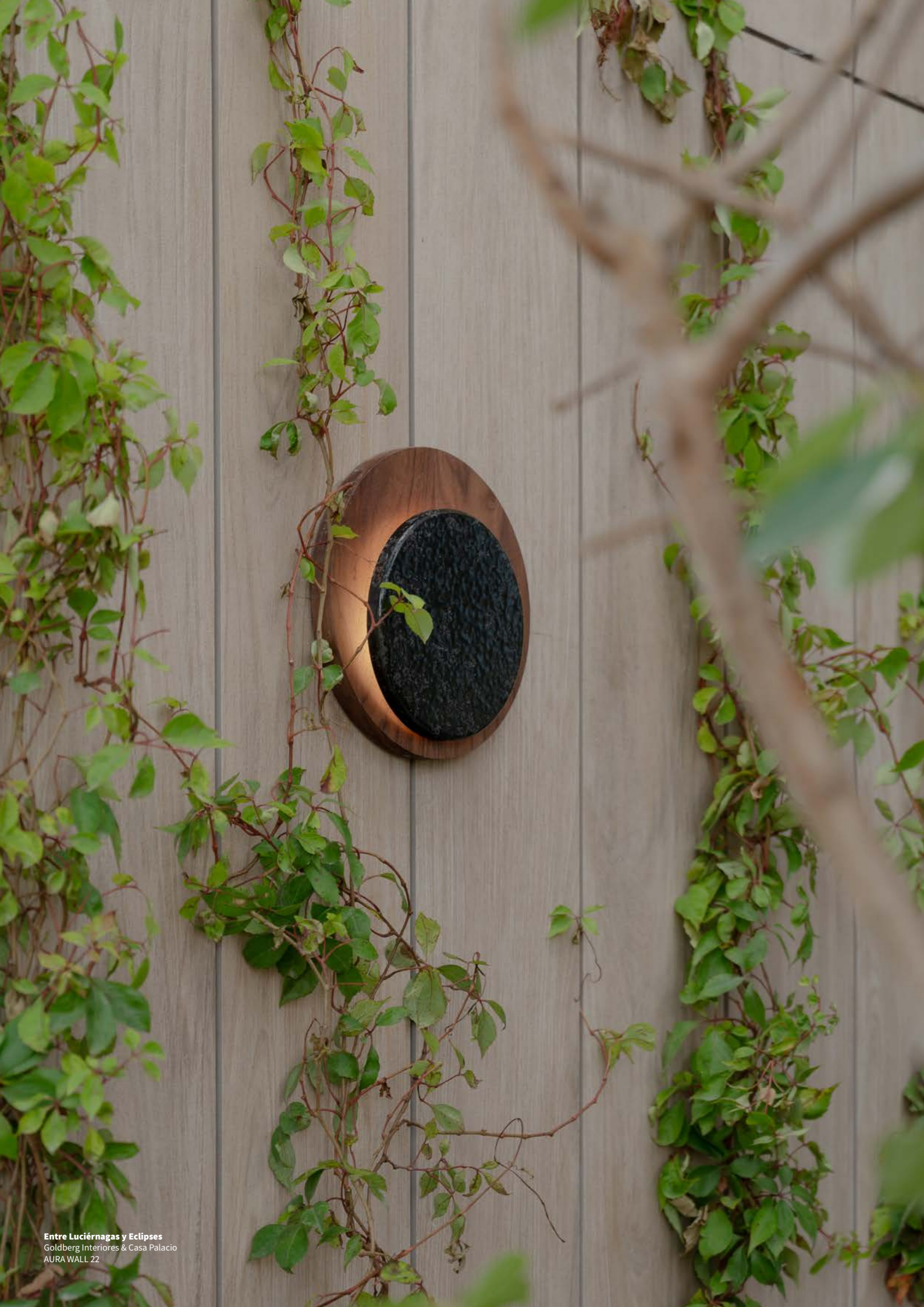
Entre Luciérnagas y Eclipses Goldberg Interiores & Casa Palacio AURA WALL 22