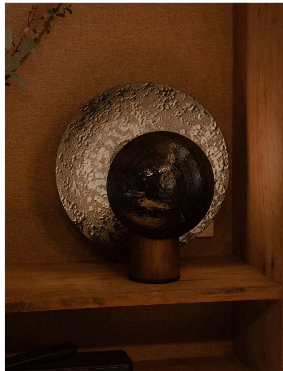
Taller de Artes y Oficios Estudio Claudina Flores & Mármoles Covarrubias AURA Lámpara de Mesa