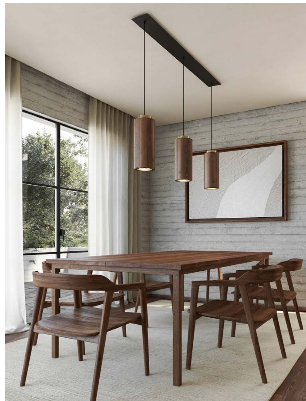
Bandido CANOPE Rectangular con Lámpara Colgante TEMPLO