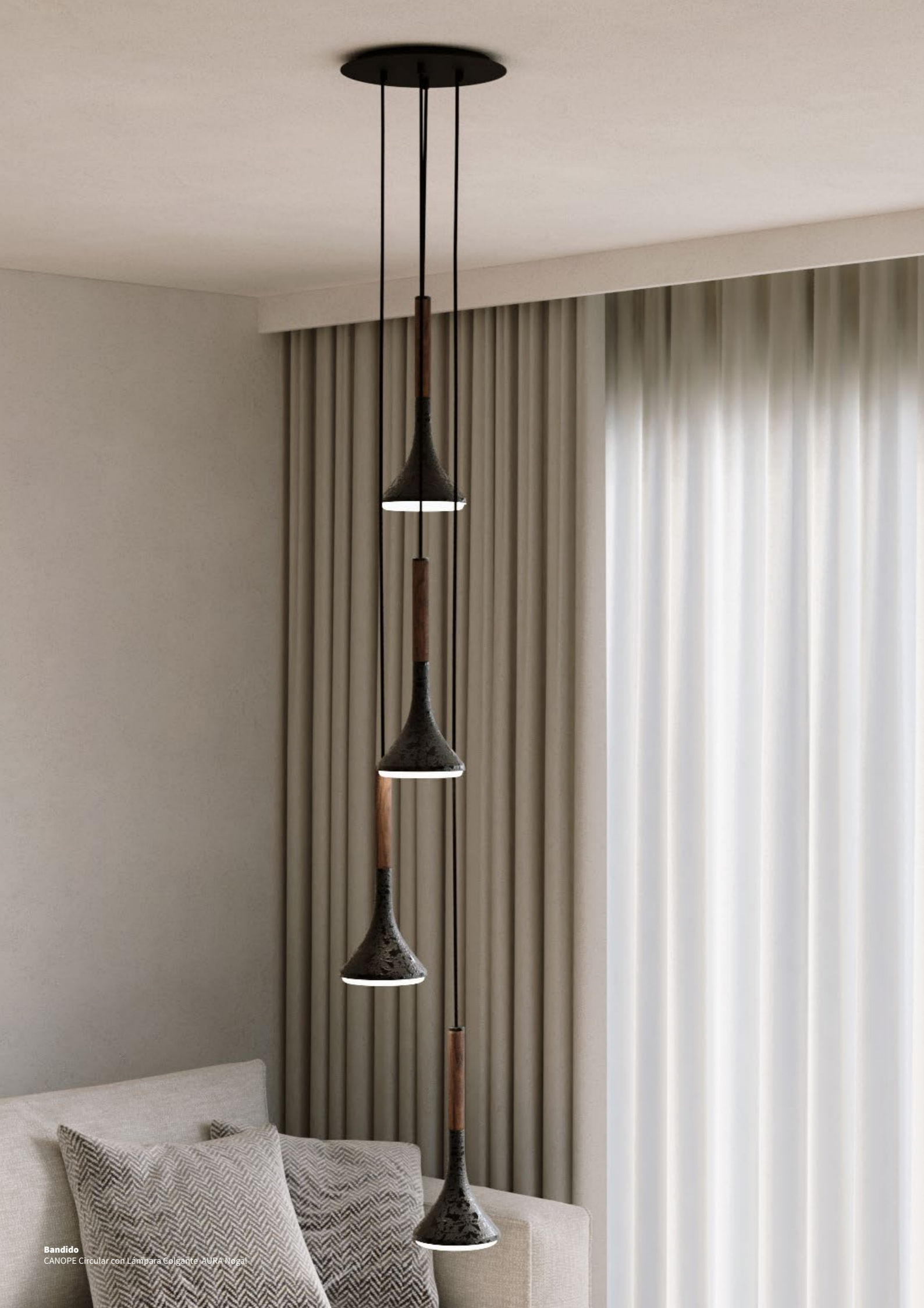
Bandido CANOPE Circular con Lámpara Colgante AURA Nogal