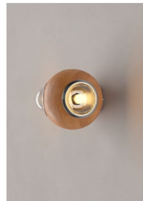
LS13 (Barro Natural)