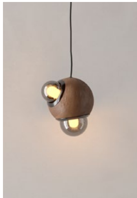
LC23 (Barro Moteado)