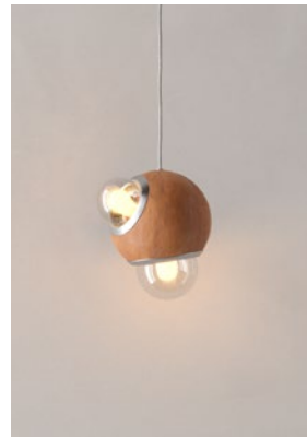
LC25 (Barro Natural)