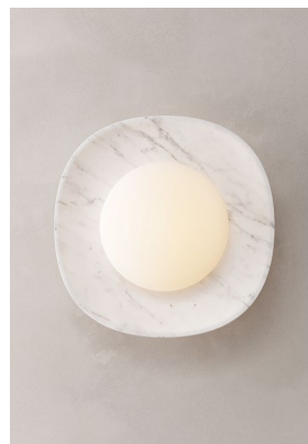
LS04 (Mármol Blanco)