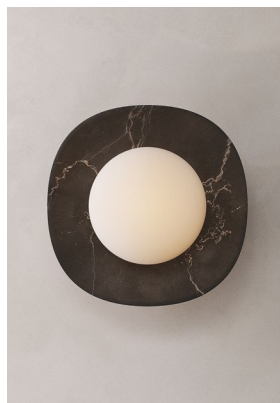
LS03 (Mármol Negro)