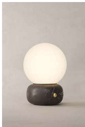
LM11 (Mármol Negro)