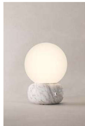
LM12 (Mármol Blanco)