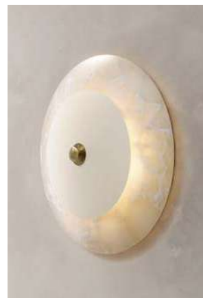
LS10 (Disco de Acero Electropintado)