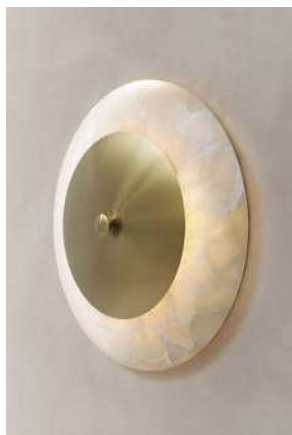
LS09 (Disco de Latón)